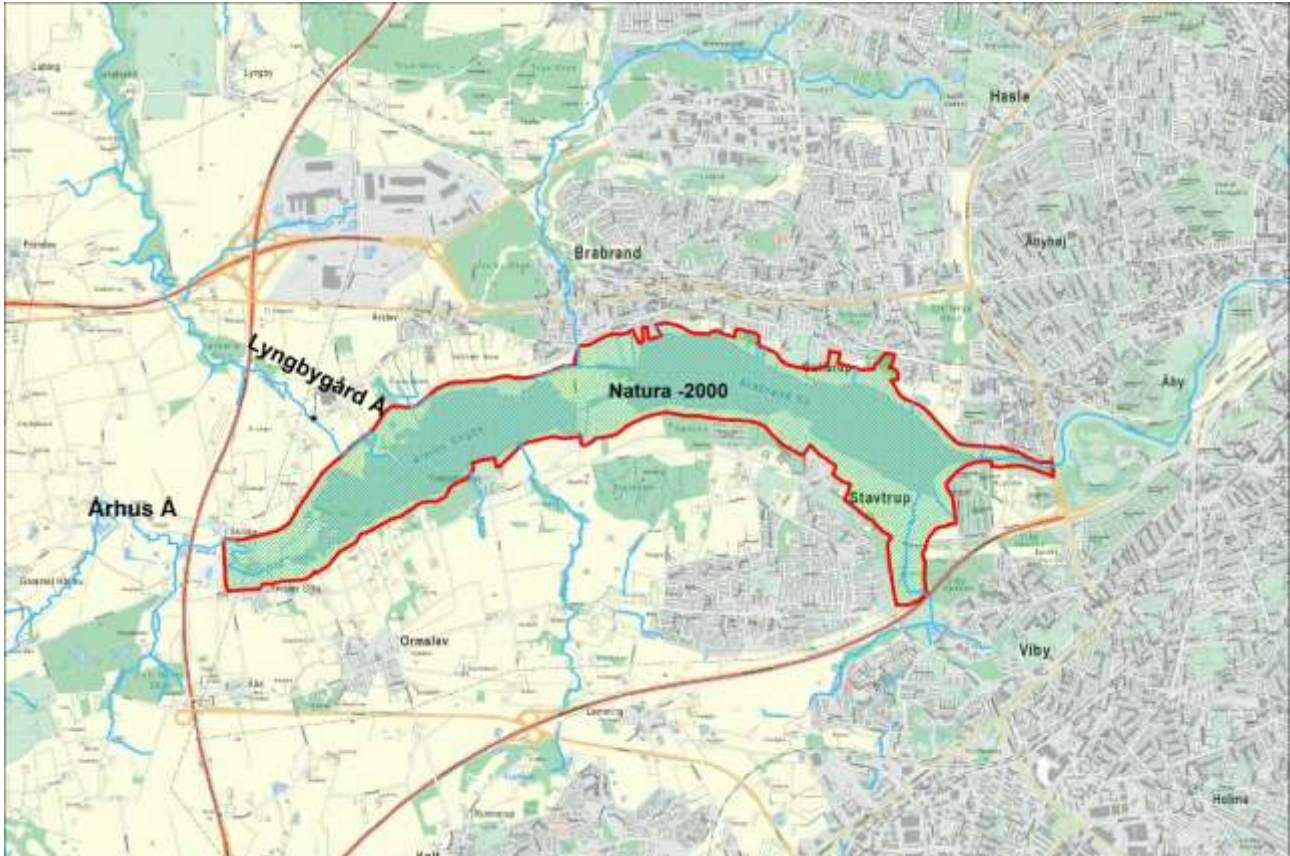
Figur 2 Natura-2000 området H233 Brabrand Sø med omgivelser